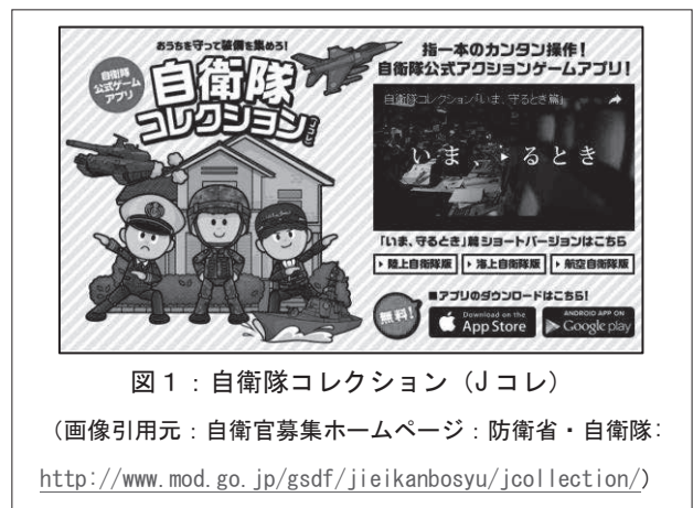
図1：自衛隊コレクション（Jコレ）