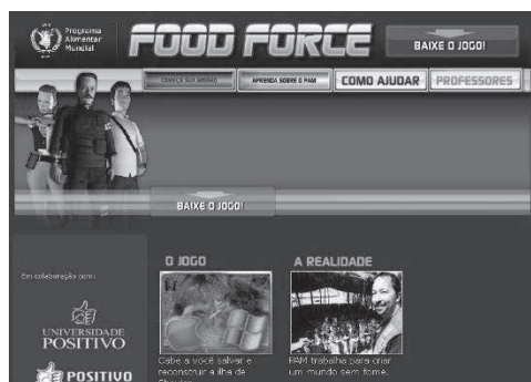
図2：政府広報ゲームの凡例は国連WFP（世界食糧計画）が無料公開しているゲーム”FOOD FORCE”

とはいえ今やゲーム産業がその市場規模を1兆円にまで拡大されているばかりか 11 、政府広報ゲームは（日本の場合）国民の税金によって企画・運営